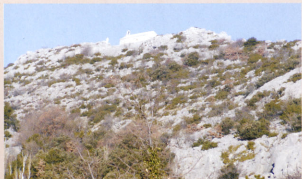
Crkva sv. Nikole

Javna ustanova "Park prirode Biokovo" prihvatila je inicijativu Društva prijatelja kulturne i prirodne baštine Breljana - Brolanenses te je izrazitim zalaganjem i naporom članova društva i djelatnika Ustanove, uz potporu Općine Brela i Splitsko-dalmatinske županije, a u suradnji s Hrvatskim prirodoslovnim muzejom i Hrvatskim biospeleološkim društvom za posjetitelje otvorila Prezentacijski centar Parka na zapadnom ulazu u sâm Park prirode Biokovo.