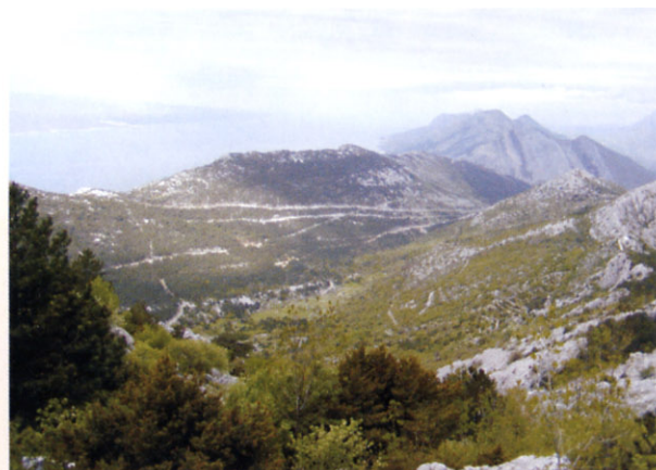
Pogled s Prve vode na breljanska vrela

U okviru započete suradnje s Društvom Brolanenses, Javna ustanova "Park prirode Biokovo" planira i uređenje poučne staze kroz Park na području Brela Gornjih, koja bi vodila od same zgrade Zavičajne zbirke Breljana u kojoj će Društvo Brolanenses u preostalim prostorijama postaviti Zavičajnu etnozbirku.